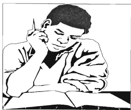
Mange av DAFs medlemmer har tatt eksamen i vår